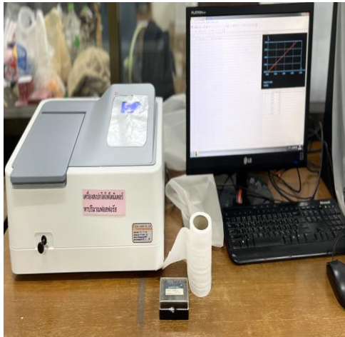
เครื่องวัดค่าการดูดกลืนแสง (Spectrophotometer)