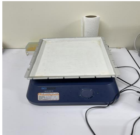
เครื่องเขย่าสาร 3 มิติ (ROCKER 3D basic)