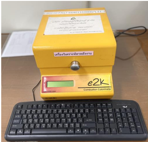
เครื่องวิเคราะห์หาพลังงาน (Bomb Calorimeter)