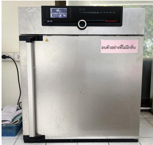
ตู้อบลมร้อน (Hot Air Oven)