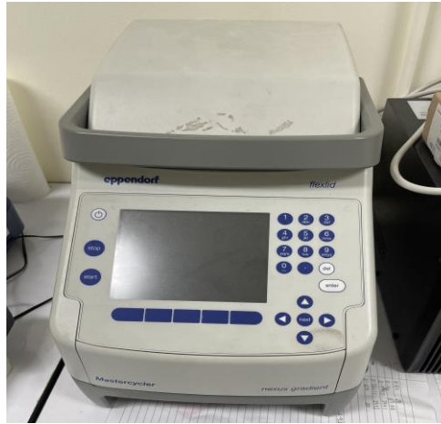
เครื่องเพิ่มปริมาณสาร พันธุกรรม (PCR Machine)