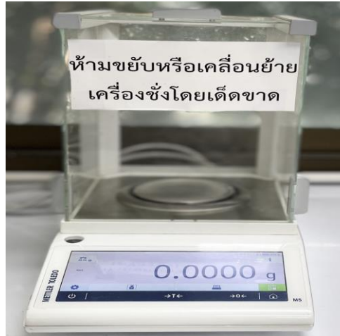
เครื่องชั่งทศนิยม 4 ตำแหน่ง (Analytical Balance)