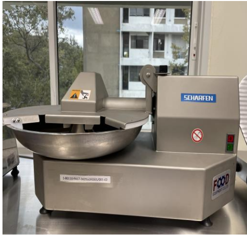
เครื่องสับผสม (CUTTER MIXER)