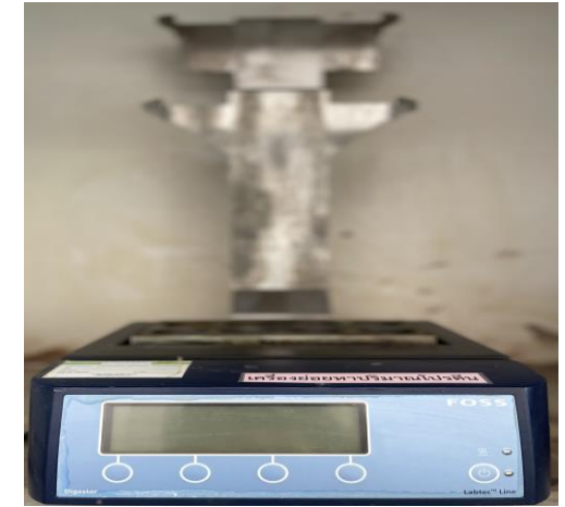
เครื่องย่อยโปรตีน (Digestion tube)