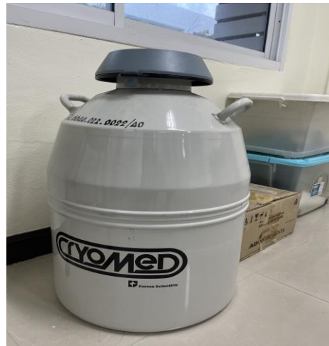
ถังบรรจุก๊าซ ไนโตรเจนเหลว