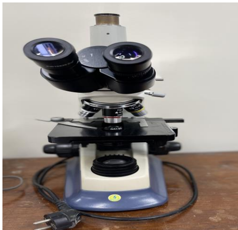
กล้องจุลทรรศน์ ชนิด 2 ตา