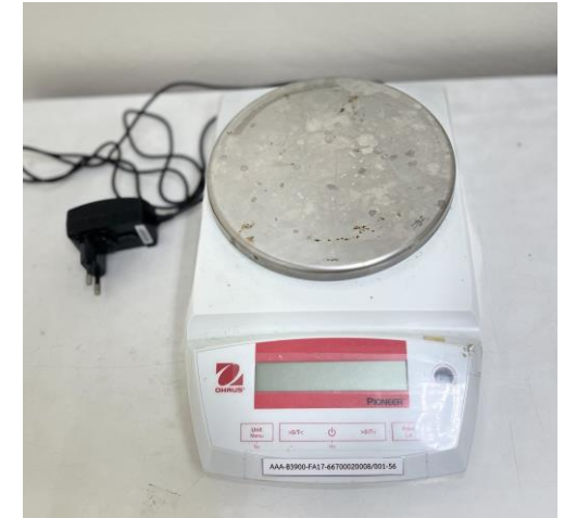
เครื่องชั่งทศนิยม 2 ตำแหน่ง (Top-Loading Balance)