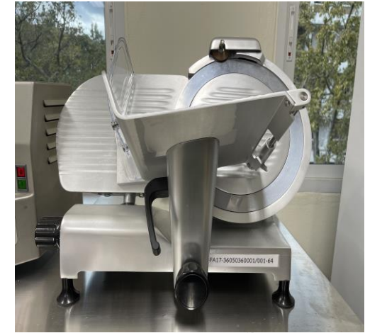
เครื่องสไลด์เนื้อ (MEAT SLICER)