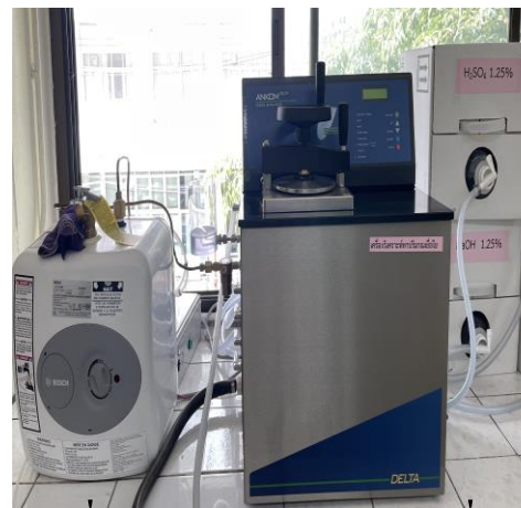
เครื่องวิเคราะห์หาปริมาณเยื่อใยแบบอัตโนมัติ (Fiber Analyzer)