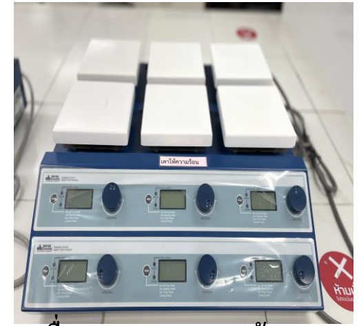
เครื่องกวนสารละลายพร้อมเตา ให้ความร้อน (Hotplate and Magnetic Stirrer)