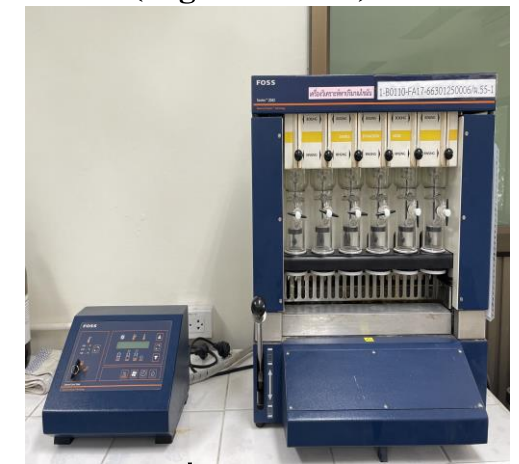
เครื่องสกัดไขมัน (Extraction System)