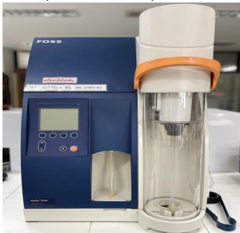
เครื่องกลั่นโปรตีน (Distillation Unit)