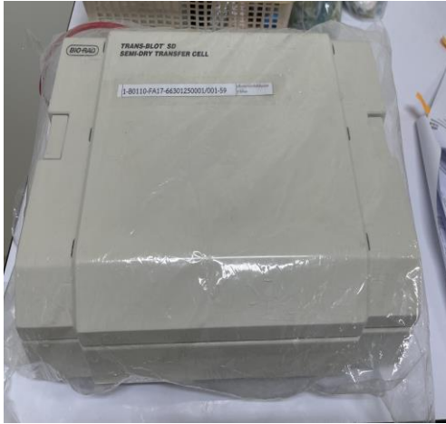
เครื่องส่งถ่ายโปรตีน ดีเอ็นเอแบบกึ่งแห้งด้วย กระแสไฟฟ้า