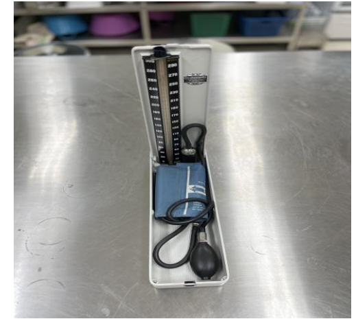
เครื่องวัดความดันโลหิตแบบ ปรอท (Mercury sphygmometer)